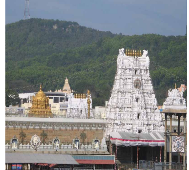
ఆశీర్వాదనం, ప్రసాదాలు అందించే విధంగా కొత్త విధానం తీసుకురావాలని యోచిస్తోంది. వివాహ వేదిక అలంకరణ, భోజన ఏర్పాట్లు, రవాణా, వసతి వంటి సేవలను పైవేలు సర్వీసు ప్రావైడర్లకు అప్పగించి, ప్రభుత్వ పర్యవేక్షణలో ప్యాకేజీగా అందించాలని ప్రతిపాదనలు రూపొందిస్తున్నారు. దీని వల్ల పెళ్లి చేసుకునే వారికి సౌలభ్యం కలగడంతో పాటు, స్థానికులకు ఉపాధి అవకాశాలు పెరుగుతాయని అధికారులు భావిస్తున్నారు. ఈ ప్రతిపాదనలకు ప్రభుత్వం ఆమోదం తెలుపితే, తిరుమల? తిరుపతి ప్రాంతం ఆధ్యాత్మికతతో పాటు వివాహ కోసం కూడా దేశవ్యాప్తంగా మరింత గుర్తింపు పొందే అవకాశం ఉందని అంచనా వేస్తున్నారు.

ప్రస్తుతం తిరుమలలో ఏటా సుమారు పదిహేను వేల నుంచి ఇరవై వేల వరకు వివాహాలు జరుగుతున్నాయి. శుభ ముహూర్తాలు ఉన్న రోజుల్లో ఈ సంఖ్య మరింత పెరుగుతుంది. తిరుపతి , తిరుచానూరు ప్రాంతాల్లో జరిగే పెళ్లిళ్లు వీటికి అదనం. ఇప్పటికే టీడీపీ వివాహాలు చేసుకునే జంటలకు కొన్ని సౌకర్యాలు అందిస్తోంది. 'కళ్యాణ వేదిక' లో వివాహం చేసుకున్న వారికి ప్రత్యేక దర్శన అవకాశం, ఆశీర్వాదన కార్యక్రమం, ప్రసాదాల పంపిణీ వంటి సదుపాయాలు ఉన్నాయి. అయితే ఈ వేదికలో ఆర్కాటాలకు అవకాశం తక్కువగా ఉండటంతో, కొందరు భక్తులు కొండపై ఉన్న పైవేలు మఠాలు, సత్రాలు లేదా దిగువ ప్రాంతాల్లోని కల్యాణ మండపాలను ఎంచుకుంటున్నారు. తొండవాడ , శ్రీనివాసముంగాపురం వంటి ప్రాంతాలు కూడా పెళ్లిళ్లకు ప్రాధాన్యం పొందుతున్నాయి. అయితే ఈ విధంగా ఇతర చోట్ల వివాహాలు చేసుకునే వారికి ఇప్పటివరకు ప్రత్యేక దర్శన సౌకర్యాలు లేకపోవడం వల్ల భక్తుల్లో అసంతృప్తి వ్యక్తమవుతోంది. ఈ అంశం ప్రభుత్వ దృష్టికి రావడంతో, ఇకపై కళ్యాణ వేదిక వెలుపల పెళ్లి చేసుకున్నా కూడా శ్రీవారి దర్శనం,